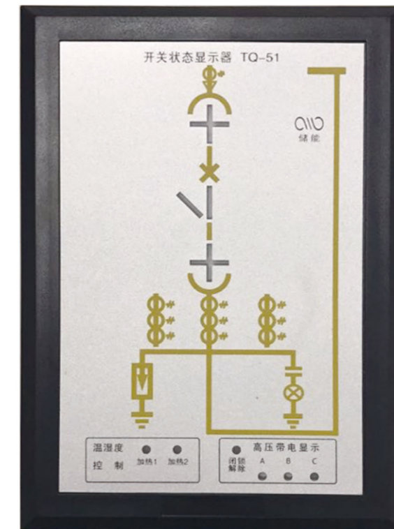
• YS-2开关柜智能显控装置实物图 •